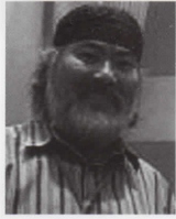
浅香 満 Mitsuru ASAKA